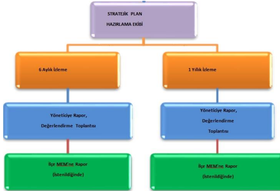
Şekil 3 İzleme ve Değerlendirme Süreci

Yıllık planın uygulanmasında yürütme ekipleri ve eylem sorumlularıyla aylık ilerleme toplantıları yapılacaktır. Toplantıda bir önceki ayda yapılanlar ve bir sonraki ayda yapılacaklar görüşülüp karara bağlanacaktır.