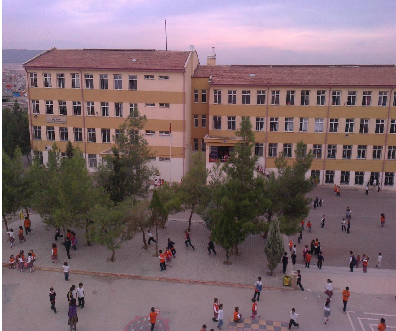
METE UYGUN İLKOKULU 2019-2023 STRATEJİK PLANI